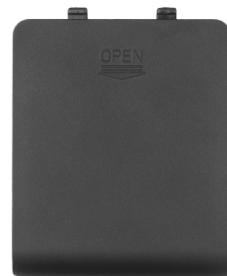
4× AA battery